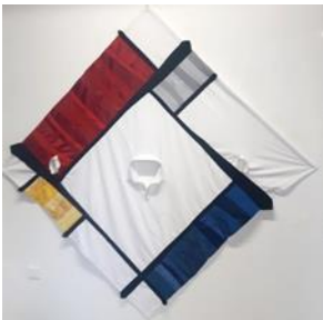
Lichel van den Ende