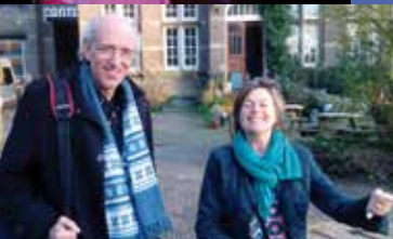
ASTRID VOLCKERICK TRIO