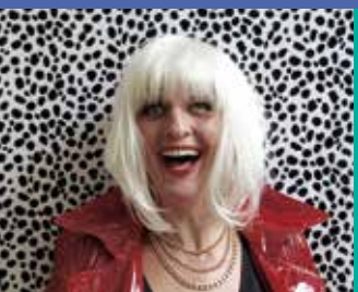
COBA IN OPTIMA