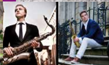
WEMPE/VAN DER ZAAL QUINTET